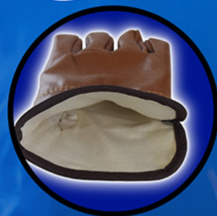
Fleece สีขาว ( Liner ) ไม่คัน ไม่เกิดอาการแพ้