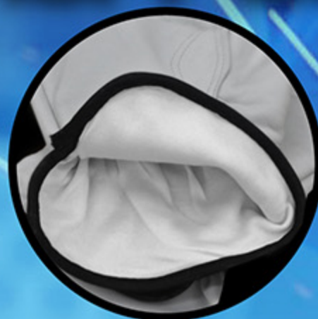
ผ้าซับในกันความร้อน