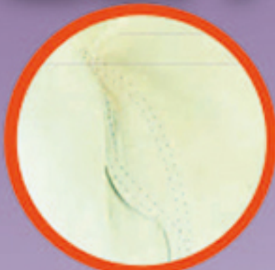
ตะเข็บรอบนิ้วโป้ง