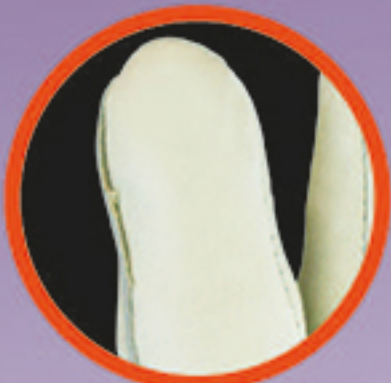
แนวตะเข็บหลังนิ้วชี้