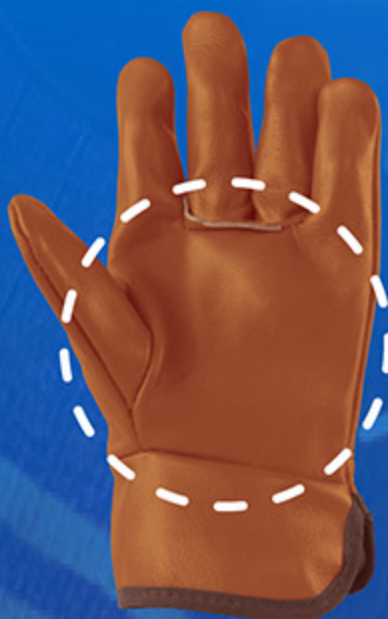
พื้มือ "ไร้รอยต่อ"