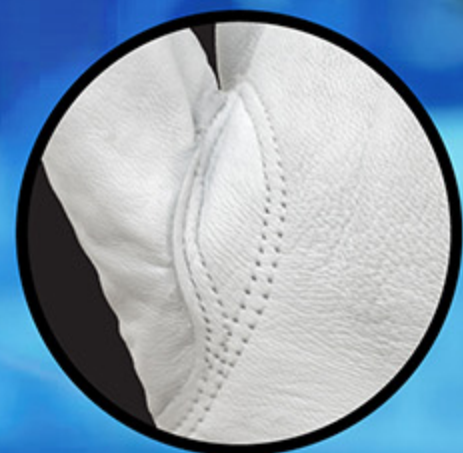
ตะเข็บรอบนิ้วโป้งแบบพิเศษ