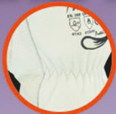
แนวเขี้ยวข้อมือ