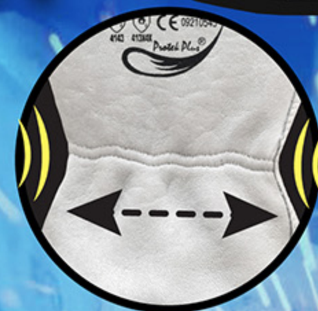
ข้อมือนางยึด